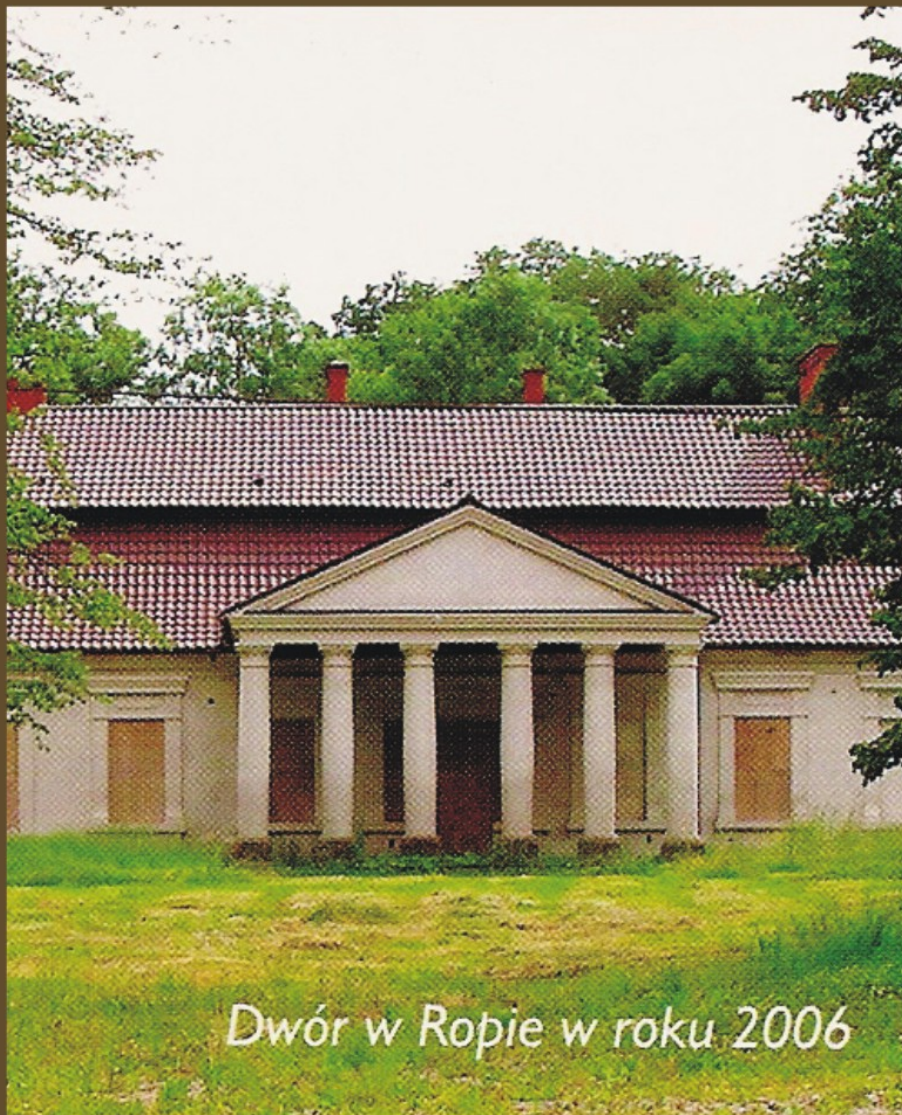
Dwór w Ropie w roku 2006