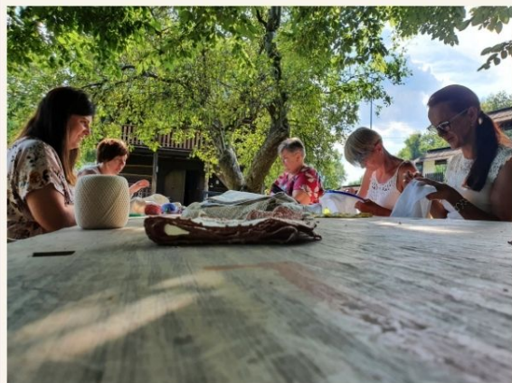
HAFT I KORONKI WSI BESKIDU NISKIEGO Z MISTRZEM TRADYCJI

Zapraszamy do galerii zdjęć z pracami wykonanymi podczas warsztatów "Haft i koronki wsi Beskidu Niskiego z Mistrzem Tradycji" oraz film z realizacji tego projektu.